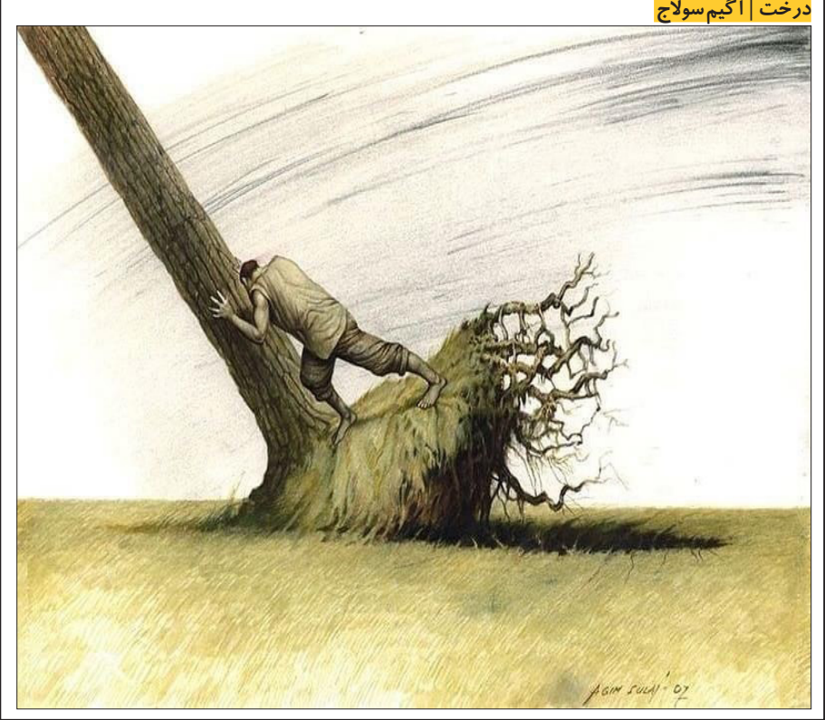
درخت آکیم سولاج

در روزهای اخیر در اکثر مناطق هوا بسیار سرد شده به طوری که در فصل پائیز این سرما کمتر سابقه داشته است. به هنگام سرما و فصل زمستان افراد آسیب‌پذیری که محل زندگی مناسب ندارند ترجیح می‌دهند فصل سرما را در زندان به سر برند حتی عمدا مرتکب جرم می‌شوند تا به زندان برده شوند، با این حال همه‌ساله تعداد بسیاری از افراد فاقد سرپناه و معتادان در فصل زمستان جان‌شان را از می‌دهند. برابر اعلام سازمان زندان‌ها تعداد زندانیان در کشور حدود ۲۰۰ هزار نفر است، ۷۰ درصد آن یعنی ۱۴۰ هزار نفر از زندانیان به‌طور مستقیم و غیرمستقیم در رابطه با جرایم مواد مخدر در زندان هستند که عدد بسیار بالایی است. اگر هزینه نگهداری و مراقبت هر زندانی را حدود دو میلیون تومان در ماه برآورد کنیم، ملاحظه می‌شود که هزینه آن برای کشور چه عدد بزرگی می‌شود. ستاد مبارزه با مواد مخدر می‌گوید تعداد معتادان حدود ۱۲/۲ میلیون نفر است و ۴/۱ میلیون نفر هم معتاد شناسایی نشده وجود دارد در این بین تعداد ۶۴ هزار نفر معتادان متجاهر هستند که حضورشان در سطح شهر و معابر به چشم می‌خورد، بعضاً در گوشه‌ای کز کرده و مشغول مصرف مواد مخدر هستند، برخی نیز در یکی از این شب‌ها از سرما تلف می‌شوند البته تعدادی از این معتادان از افغانستان هستند که در کشور ما زندگی می‌کنند. افرادی که به صورت تقننی و آزمایشی مواد مخدر مصرف کرده و تصور نمی‌کنند معتاد شوند باید بدانند که در راهی بدون بازگشت نام نهاده‌اند و زمان زیادی نخواهد گذشت که این افراد هم به خیل معتادان خواهند پیوست.