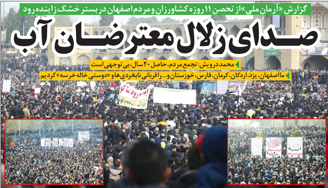
گزارش «آرمان ملی» از تحسن ۱۱روزه کشاورزان و مردم اصفهان در بستر خشک زاینده رود محمد درویش: تجمع مردم، حاصل ۲۰ سال، بی توجهی است ما اصفهان، یزد، اردکان، کرمان، فارس، خوزستان و... را قربانی نابخردی ها و «دوستی خاله خرسه» کردیم

آرمان ملی: مدیرعامل سازمان انتقال خون ایران، گفت: انبارهای استراتژیک انتقال خون در کشور باید تجهیز و گسترش پیدا کنند و با انبار کافی نداریم. ما به گسترش فضاهای استراتژیک نیاز داریم. پیمان ششقی بسا اشاره به اینکه هزینه های نگهداری خون بند ناف ۱۵ تا ۲۰ میلیون تومان برای هر واحد است، افزود: سازمان انتقال خون این خدمات را رایگان ارائه می دهد، اما بهتر است تعرفه ای برای آن در نظر گرفت تا هزینه های سازمان انتقال خون جبران شود.