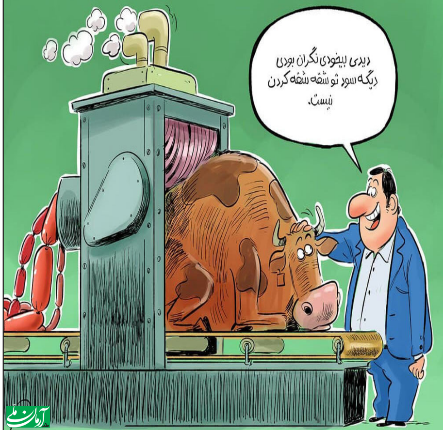
متن: خیر آتلایان

سوسیس از گوشت گران تر شد! قیمت سوسیس و کالباس با افزایش عجیب، از گوشت فراتر رفت، به طوری که زامبون به کیلویی ۲۷۰ هزار تومان رسید.