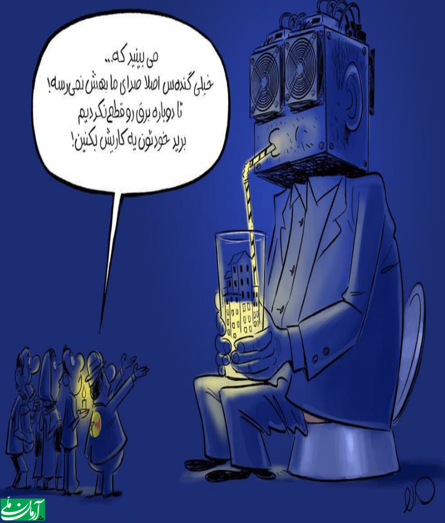
متن: خیر آتلاین

میزان فعالیت استخراج رمزارزها برابر با مجموع توان متوسط مصرفی سالانه سه کلان شهر مشهد، اصفهان و تبریز در سال ۱۳۹۹ است.