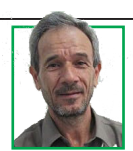
عبد... افراسیایی تحلیلگر مسائل فرهنگی