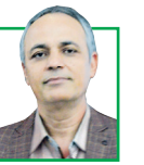
احمد زید آبادی روزنامه‌نگار و فعال سیاسی