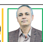
احمد زید آبادی روزنامه نگار و فعال سیاسی