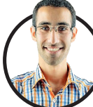
پیام پور فلاح