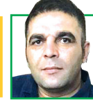
امید فراغت روزنامه نگار