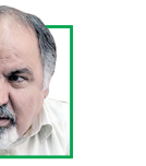
ابراهیم جمیلی رئیس خانه اقتصاد ایران