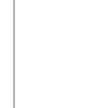
حسن بهشتی پور تحلیلگر مسائل بین الملل