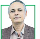
روزنامه‌نگار و فعال سیاسی