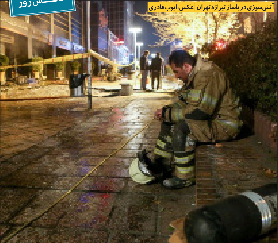
آتش سوزی در بازار تیرازه تهران

منتقدان به دولت توصیه کردند که در مقابل طرح بدنام موسوم به صیانت... موضع گیری کند و خواستار خارج شدن آن از دستور کار مجلس شود. دولت اما به‌رغم اصرار بر عدم وجود برنامه‌ای برای محدودیت اینترنت، عملاً در مقابل طرح مجلس سکوت کرده و مجلس هم با وجود توصیه عموم کارشناسان و حساسیت عموم مردم، گام به گام طرح خود را پیش می‌برد. این طرح هر چه باشد و نباشد، در افکار عمومی به شدت بدنام شده و مورد حساسیت شدید جامعه است. با این حساب، حداقل تدبیر و درایت، به لغو و ابطال آن حکم می‌کند. اصرار بر تصویب این طرح از یک طرف، لجابت در برابر مردم و از طرف دیگر خودزنی تبلیغاتی است؛ حتی اگر اجرای طرح تغییری معنادار در شرایط کنونی اینترنت در کشور پدید نیارد. واقعاً در این نوع کارهای زیانبار و امیدگش هم لذتی نهفته است که عده‌ای سخت به آن چسبیده‌اند؟