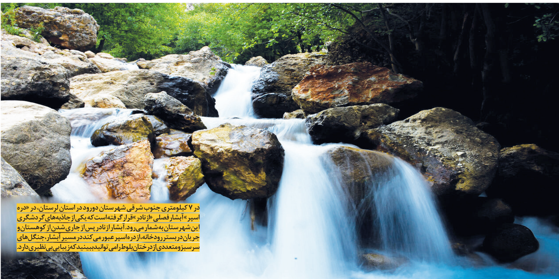
در ۷ کیلومتری جنوب شرقی شهرستان دورود در استان لرستان، در «دره اسپر» آبشار فصلی «ز نادر» قرار گرفته است که یکی از جاذبه‌های گردشگری این شهرستان به‌شمار می‌رود. آبشار از نادر پس از جاری شدن از کوهستان و جریان در بستر رودخانه، از دره اسپر عبور می‌کند در مسیر آبشار، جنگل‌های سرسبز و متعددی از درختان بلوط را می‌توانید ببینید که زیبایی بی‌نظیری دارد.