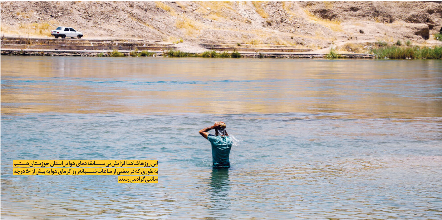
این روزها شاهد افزایش بی سابقه دمای هوادر استان خوزستان هستیم به طوری که در بعضی از ساعات شبانه روز گرمای هوا به بیش از ۵۰ درجه سانتی گراد می رسد.