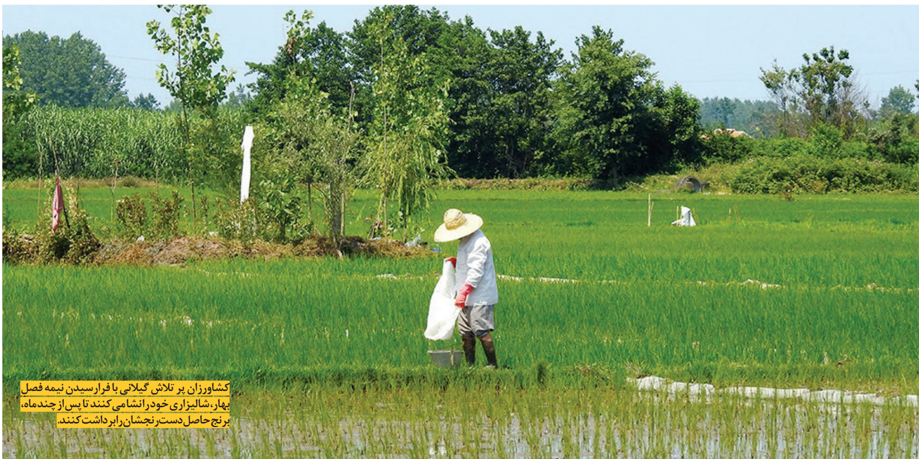
کشاورزان پر تلاش گیلانی با فرا رسیدن نیمه فصل بهار، شالیزارهای خود را نشانی کنند تا پس از چند ماه، برنج حاصل دسترنجشان را برداشت کنند.