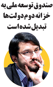
رئیس کل دیوان محاسبات کشور