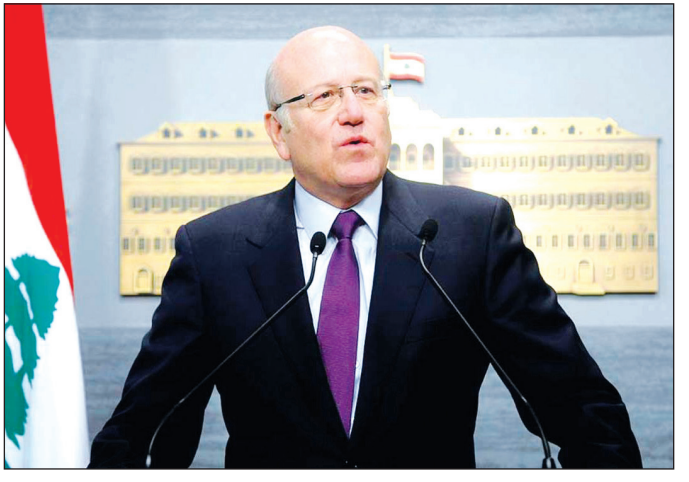
مردم صادق خواهیم بود. میقاتی در ادامه خواستار تعیین نخست‌وزیر جدید و تشکیل

دولت در سریع‌ترین زمان ممکن شد. نخست‌وزیر لبنان در این باره تصریح کرد: چالش‌های پیش‌روی کشور مستلزم وجود مدیریت قوی و همکاری همه طرف‌هاست و در تصمیم‌گیری درباره پرونده‌ها درنگ نشوند، چراکه شرایط اجازه هیچ‌گونه تعلل را نمی‌دهد. وی همچنین تأکید کرد: به‌رغم دشوار بودن شرایط کشور ما به وعده‌مان عمل کردیم و انتخابات پارلمانی را با شفافیت مطلق به پایان رساندیم. میقاتی در بخش دیگری از اظهاراتش با اشاره به مذاکرات لبنان با صندوق بین‌المللی پول نیز افزود: فرصت‌های نجات کشور بدون بانک جهانی در دسترس نخواهد بود و بانک لبنان باید استانداردهای لازم را برای تضمین رشد اقتصاد تعیین کند.