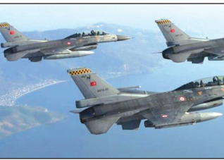
تشدید آشکار رفتار تحریک‌آمیز ترکیه است. این در حالیست که یونان پیش‌تر نیز اعتراض شدیدالحن خود را در خصوص نقض حریم هوایی آن از سوی جنگنده‌های نیروی هوایی ترکیه به اطلاع آنکارا رسانده است.