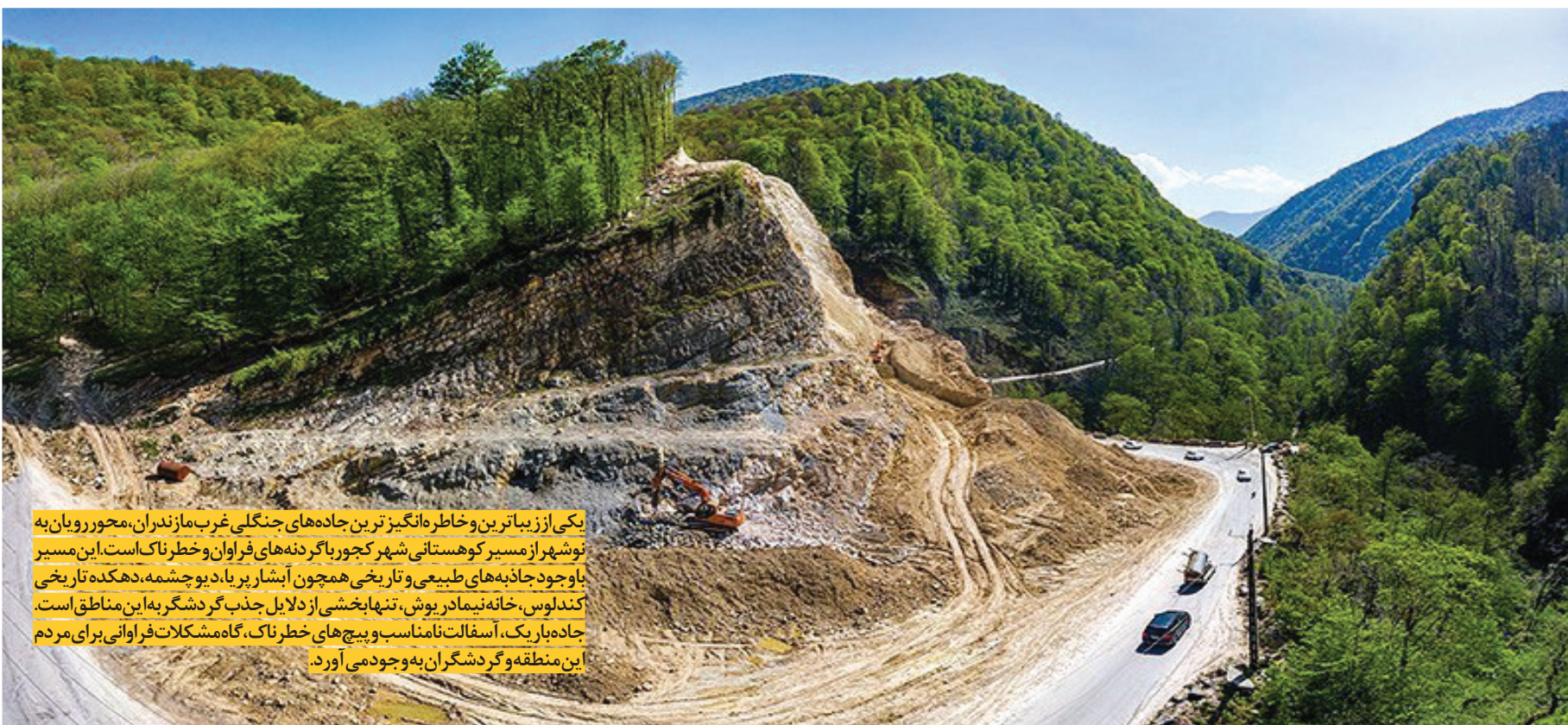
یکی از زیباترین و خاطر‌انگیزترین جاده‌های جنگلی غرب مازندران، محور رویمان به نوشهر از مسیر کوهستانی شهر گجور با گردنه‌های فراوان و خطرناک است. این مسیر با وجود جاذبه‌های طبیعی و تاریخی همچون آبشار براباد و چشمه دهکده تاریخی کندلوس، خانه نیمادر پوش، تنها بخشی از دلایل جذب گردشگر به این مناطق است. جاده‌باریک، آسفالت نامناسب و پیچ‌های خطرناک، گاه مشکلات فراوانی برای مردم این منطقه و گردشگران به وجود می‌آورد.