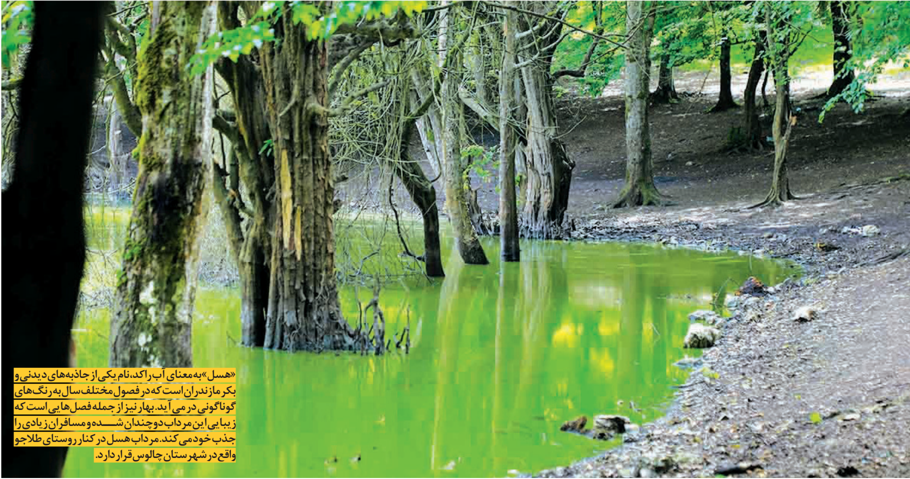
«هسل» به معنای آب را کند، نام یکی از جاذبه‌های دیدنی و بکر مازندران است که در فصول مختلف سال به رنگ‌های گوناگونی در می‌آید. بهار نیز از جمله فصل‌هایی است که زیبایی این مرداب دوچندان شده و مسافران زیادی را جذب خود می‌کند. مرداب هسل در کنار روستای طلاجو واقع در شهرستان چالوس قرار دارد.