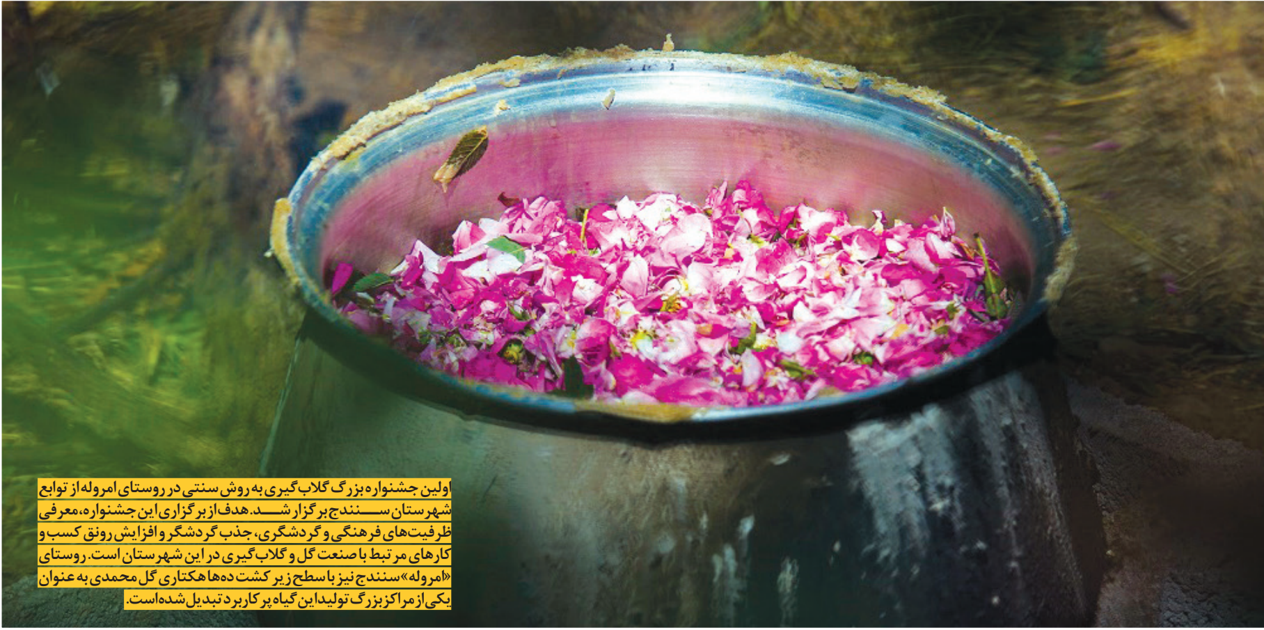
ولین جشنواره بزرگ گلاب گیری به روش سنتی در روستای امروله از توابع شهرستان سنندج برگزار شد. هدف از برگزاری این جشنواره، معرفی ظرفیت‌های فرهنگی و گردشگری، جذب گردشگر و افزایش رونق کسب و کارهای مرتبط با صنعت گل و گلاب گیری در این شهرستان است. روستای «امروله» سنندج نیز با سطح زیر کشت ده‌ها هکتار گل محمدی به عنوان یکی از مراکز بزرگ تولید این گیاه پرکاربرد تبدیل شده است.