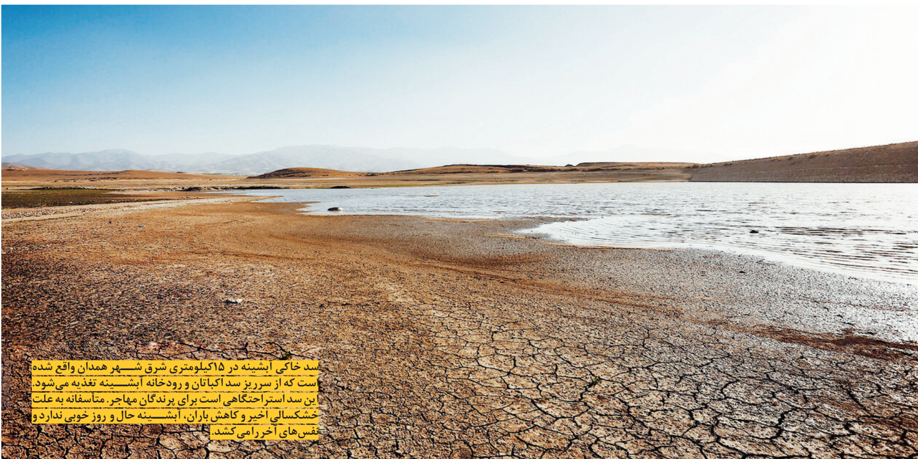
سد خاکی آیشینه در ۱۵ کیلومتری شرق شهر همدان واقع شده است که از سرریز سد اکباتان و رودخانه آیشینه تغذیه می‌شود. این سد استراحتگاهی است برای پرندگان مهاجر. متأسفانه به علت خشکسالی اخیر و کاهش باران، آیشینه حال و روز خوبی ندارد و نفس‌های آخر را می‌کشد.