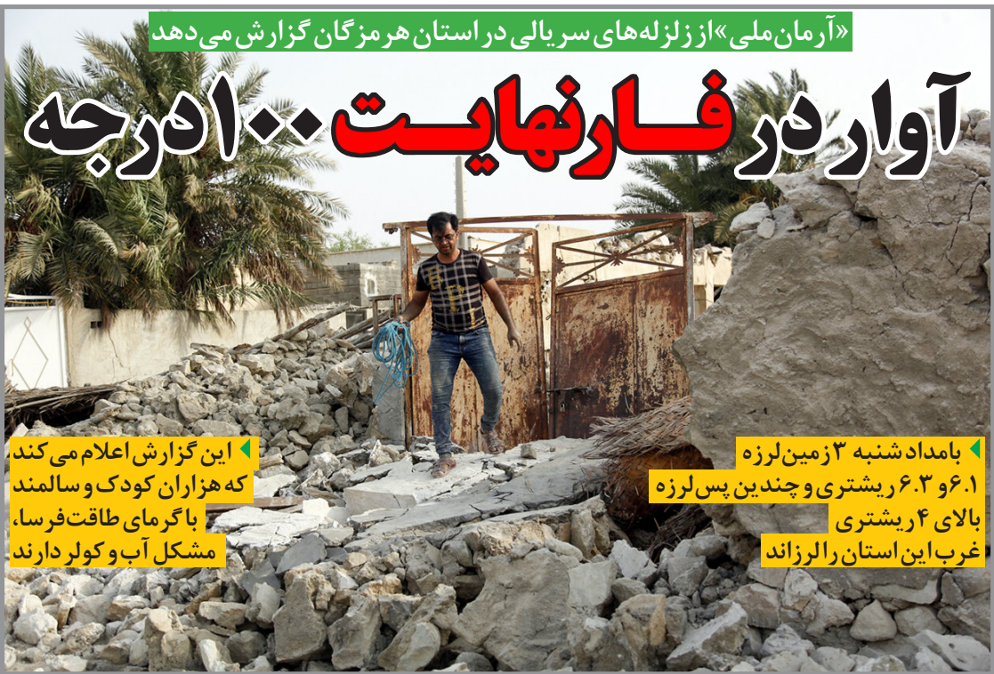
«آرمان ملی» از زلزله‌های سربالی در استان هرمزگان گزارش می‌دهد

آرمان ملی: گردوغباری که در برخی شهرهای خوزستان رخ داده، میزان غلظت ذرات آلاینده را در شهرهای بندرام خمینی (ره)، ماهشهر و سوسنگرد به حدود ۹ برابر حد مجاز افزایش داد. شاخص کیفی هوای شهرهای اهواز ۴۰۸، بندرامام خمینی (ره) ۵۰۰، دزفول ۳۴۵، شادگان ۵۰۰ و ماهشهر ۵۰۰ در شرایط خطرناک؛ شاخص کیفی هوای اندیشک ۲۴۶ در شرایط بسیار ناسالم؛ شاخص کیفی هوای شهرهای آبادان ۱۸۸، حمیدیه ۱۶۴، رامشیر ۱۵۶، شوشتر ۱۶۵ و هندیجان ۱۸۷ در شرایط ناسالم برای همه گروه‌ها؛ شاخص کیفی هوای شهرهای امیدیه ۱۲۲ و ابدیه ۱۰۲ در شرایط ناسالم برای گروه‌های حساس و شاخص کیفی افزایش دوباره موارد بیماری، ممنوعیت‌ها و محدودیت‌های کرونا اعلام نمی‌شود و ستاد دولتی کرونا نیز تنها پیشنهاد به اطلاع‌یه‌های روابط عمومی وزارت بهداشت و درمان می‌کند