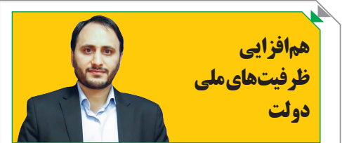
هم‌افزایی ظرفیت‌های ملی دولت