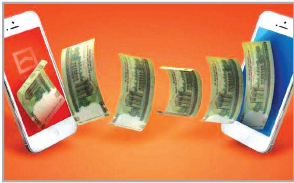
رئیس پلیس فتا استان خوزستان از کشف یک پرونده و عودت وجه به مبلغ ۱۹ میلیارد ریال به حساب شاکی خبر داد.

به همراه همسر خود با حالات روحی کاملا مضطرب و پریشان، اظهار داشت: «مبلغ ۱۹ میلیارد ریال را اشتباها به صورت پرداخت الکترونیکی به دو حساب مختلف واریز نمودم که مالکان حسابها حاضر به بازگرداندن مبلغ نیستند که موضوع به صورت ویژه در دستور کار پلیس فتا شهرستان شوش قرار گرفت.» وی افزود: با توجه به اظهارات شاکی و بررسی‌های صورت گرفته طبق روال قانونی مصالحه در این پرونده با مالکان حساب‌ها نتیجه‌ای نداشت و مالکان به هیچ عنوان حاضر به عودت وجه دریافتی به حساب شاکی نبوده‌اند. این مقام انتظامی ادامه داد: با در نظر گرفتن این موضوع که احتمال برداشت مبلغ از حساب‌ها توسط مالکان متصور است با هماهنگی‌های قضائی مبلغ در حساب‌های مقصد مسدود و طبق روال قانونی با مراجعه شاکی به دادسرا و اخذ جرعه قضائی عودت وجه به حساب شاکی انجام گرفت. سرهنگ حسینی به هموطنان توصیه کرد: قبل از انتقال مبلغ به روش‌های پرداخت الکترونیک هوشیاری لازم را داشته باشید با توجه به اینکه احتمال عدم همکاری از سوی مالکان حساب‌های مقصد و یا برداشت مبلغ متصور است، این موضوعات می‌تواند بازگرداندن مبلغ را به حساب‌های مبدا سخت‌تر کند. رئیس پلیس فتا استان خوزستان اعلام کرد: در صورت وقوع هرگونه کلاهبرداری در فضای سایبری بلافاصله موضوع را جهت بررسی کارشناسان پلیس فتا با شماره ۰۹۶۳۸۰ در میان بگذارند.