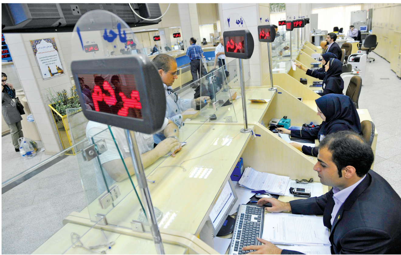
وقتی رضایت مراجعین به سیستم بانکی یکی از دغدغه‌های اصلی کارمندان باشد، کلمه‌ی مردم همیشه پیش روی آنهاست و آن را بالای سر خود احساس می‌کنیم. تکریم کارمند از مردم همان احترام به خویش است. یکی از شعب بانک صادرات / تهران