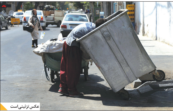
عکس تزئینی است

◀ خفتگی‌ری از راننده تاکسی اینترنتی، به مرگ یک کودک زباله‌گرد در اسلامشهر منجر شد