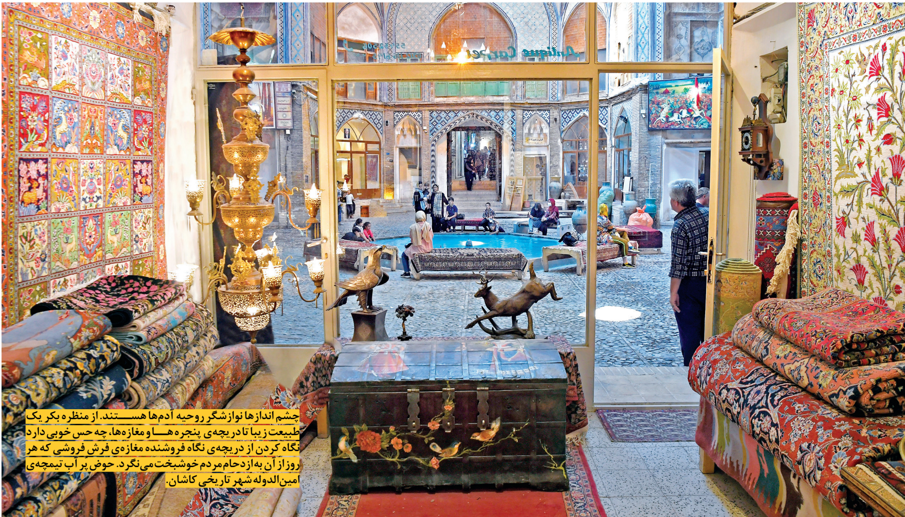
چشم اندازها نواز شکر روحیه آدمها هستند. از منظره بکر یک طبیعت زیبا تا در پیچه پنجره هسا و مغازه ها، چه حس خوبی دارد نگاه کردن از در پیچه نگاه فروشنده مغازه ی فرش فروشی که هر روز از آن به از دام مردم خوشبخت می نگرد. حوض پر آب تیمچه ی امین الدوله شهر تاریخی کاشان.