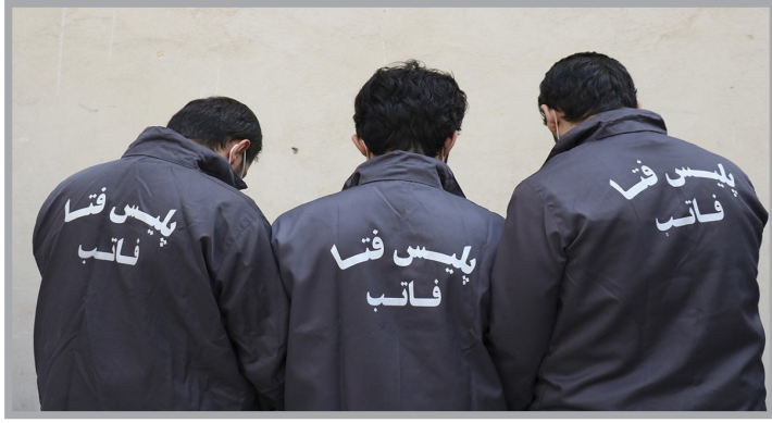
فرمانده انتظامی استان زنجان از شناسایی و دستگیری فردی که با ادعای برنده شدن در مسابقه‌ای در رادیو جوان ۱۰ میلیارد ریال از ۲۵ شهروندان کلاهبرداری کرده بود توسط کارشناسان پلیس فتا تحقیقات خود را در