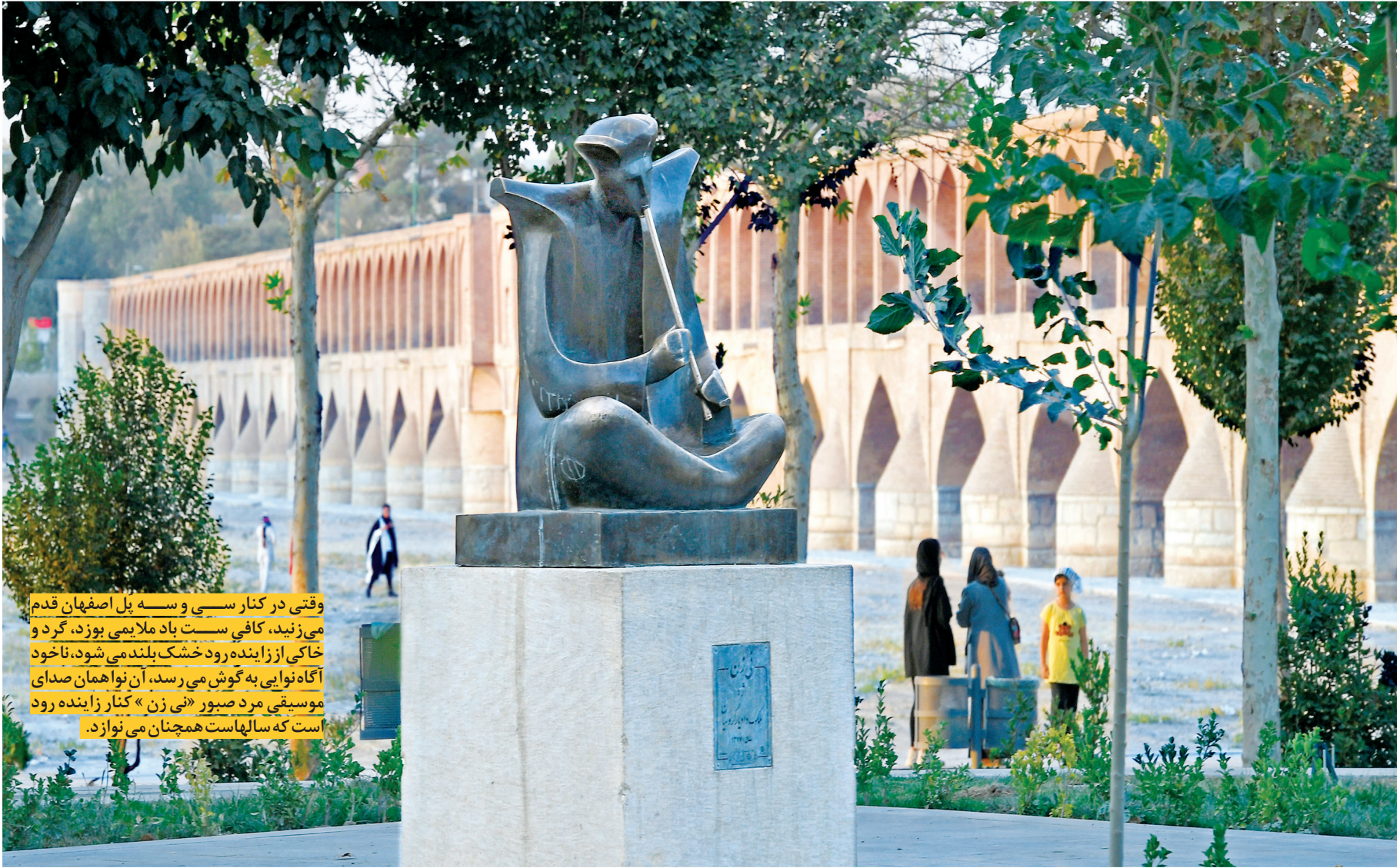
وقتی در کنار سسی و سه بل اصفهان قدم می‌زنی، کافی سست باد ملایمی بوزد، گرد و خاکی از زاینده رود خشک بلند می‌شود، ناخود آگاه نوایی به گوش می‌رسد. آن نوا همان صدای موسیقی مرد صبور «نی زن» کنار زاینده رود است که سالیهاست همچنان می نوازد.