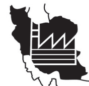
شرکت شهرکهای صنعتی فارس

شرکت شهرکهای صنعتی فارس در نظر دارد تعدادی قطعه زمین از طریق مزایده عمومی با ارزیابی کیفی و طبق ضوابط و مقررات و دستورالعمل حق بهره برداری سازمان صنایع کوچک و شهرکهای صنعتی ایران به اشخاص حقیقی و حقوقی واجد شرایط تخصیص دهد. لذا بدینوسیله از کلیه متقاضیان دعوت می شود نسبت به ثبت نام در سامانه تدارکات الکترونیک دولت بخش مزایده سپس نسبت به دریافت اسناد از طریق سامانه اقدام نمایند. تاریخ اخذ اسناد در سامانه تدارکات الکترونیک دولت: از ۱۴۰۱/۱۱/۱۹ لغایت ۱۴۰۱/۱۱/۱۹ (ساعت ۱۳) آخرین مهلت تسلیم پیشنهادها، در سامانه تدارکات ساعت ۱۳ مورخ ۱۴۰۱/۱۲/۰۳ و فیزیکی پاکت الف (ضمائم نامه یا فیش نقدی) تا پایان ساعت اداری مورخ ۱۴۰۱/۱۲/۰۳ دبیرخانه شرکت. تاریخ کمیته بازگشایی و دیدعه و ارزیابی کیفی: ساعت شروع ۰۸:۳۰ صبح مورخ ۱۴۰۱/۱۲/۰۷ تاریخ کمیته بازگشایی قیمت های پیشنهادی: ساعت شروع ۸ صبح مورخ ۱۴۰۱/۱۲/۰۹ سایر اطلاعات و جزئیات مربوطه در اسناد فراخوان درج شده است.