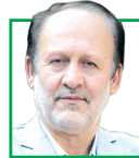
سید جلال ساداتیان سفير اسبق ایران در بریتانیا