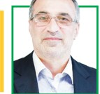
امیر رضا واعظ آشتیانی فعال سیاسی