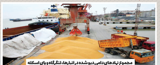
مجموع نهادهای دامی دپو شده در انبارها، لنگرگاه و پای اسکله

طبق آخرین گزارش مرکز پژوهش های مجلس گرچه در چند روز اخیر بخشی از این اقلام دپویی تخلیه شده اما چنانچه اقدام فوری برای تخلیه بارهای دپو شده در بندر امام صورت نگیرد، علاوه بر قفل شدن یکی از بزرگترین مسابای وارداتی، نهادهای دامی زیادی هم در این بندر ناسد شده و به ضایعات تبدیل خواهد شد.