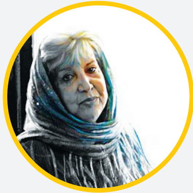
مرا هزار امید است و هر هزار تویی شروع شادی و پایان انتظار تویی

بهارها که ز مرم گذشت و بی تو گذشت چه بود غیر خزانها اگر بهار تویی