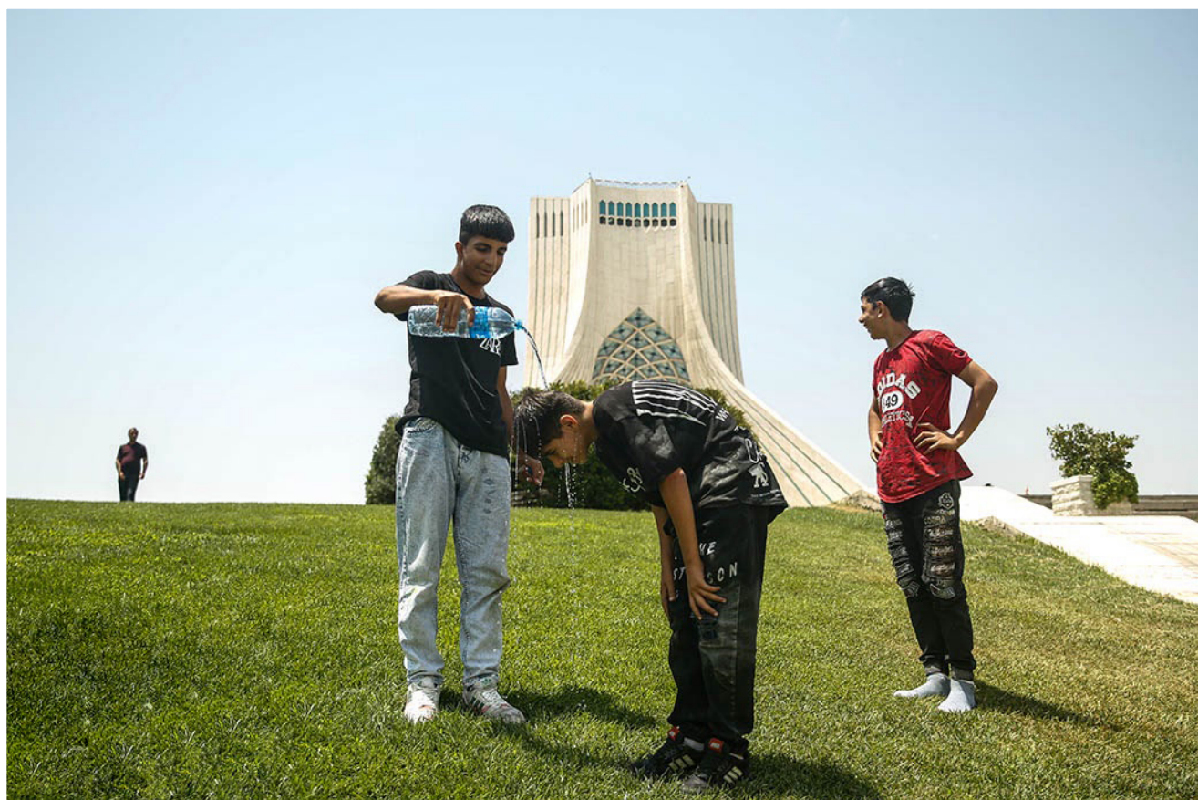
ماندگاری هوای گرم در استان تهران همراه با افزایش نسبی دما همراه است. با توجه به افزایش دما به شهروندان توصیه می شود کودکان، سالمندان، بیماران قلبی، ربوی و عروقی از ترددهای غیرضروری خودداری کنند، زیرا علاوه بر هوای گرم، افزایش اشعه ماورای بنفش و آوزون سطحی نیز وجود دارد.