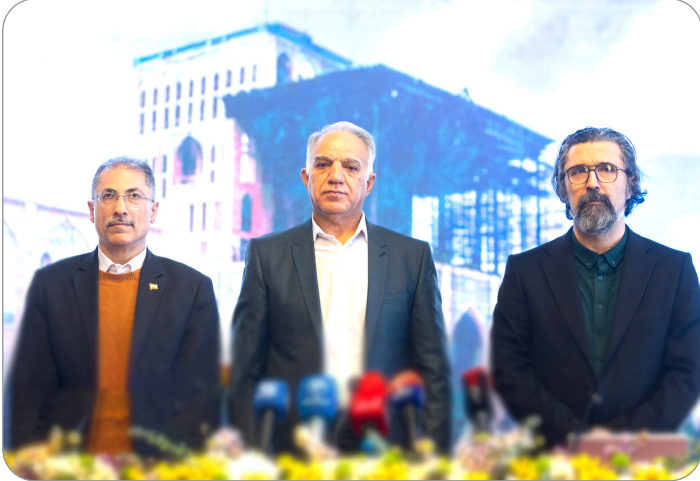
سرپرست دفتر موسیقی: