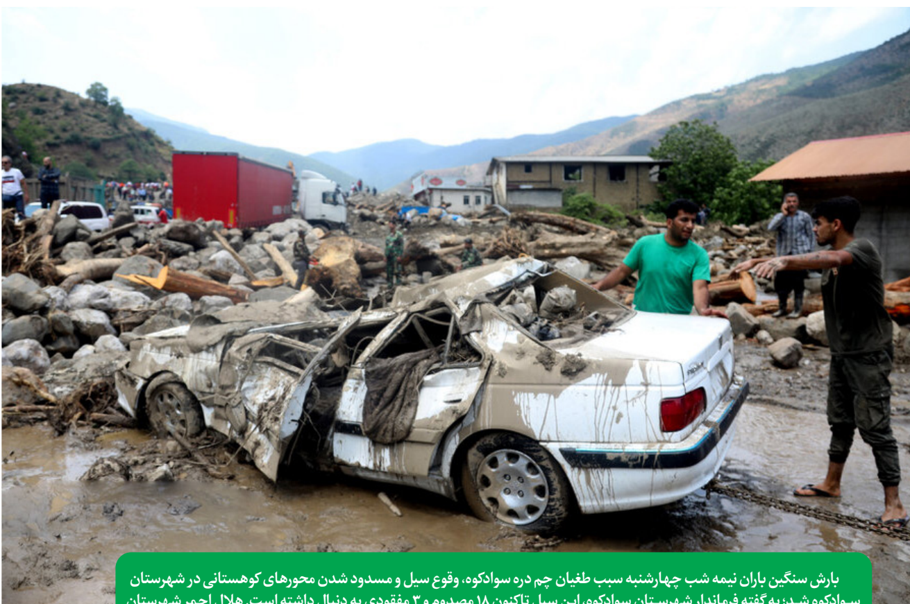
بارش سنگین باران نیمه شب چهارشنبه سبب طغیان چم دره سوادکوه، وقوع سیل و مسدود شدن محورهای کوهستانی در شهرستان سوادکوه شد؛ به گفته فرماندار شهرستان سوادکوه، این سیل تاکنون ۱۸ مصدوم و ۳ مفقود به دنبال داشته است. هلال احمر شهرستان نیز از انتقال مصدومان به مراکز درمانی و اسکان اضطراری گرفتارشدها در سیل خبر داد. در این حادثه بسیاری از زمین‌های کشاورزی حریم رودخانه، سردهنه‌های کشاورزی و راه‌های ارتباطی آسیب جدی دید. همچنین به منازل مسکونی و خودروهایی که در مسیر رودخانه قرار داشتند، خسارت‌های سنگینی وارد شد.