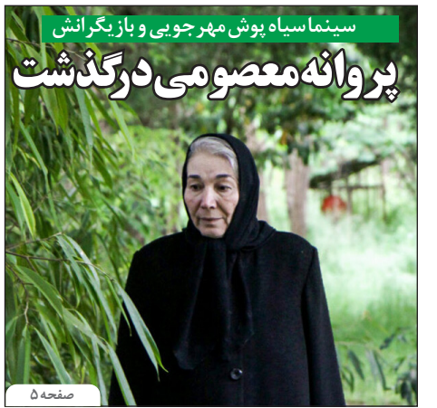
سینما سیاه پوش مهرجویی و بازنگرانش پروانه معصومی درگذشت صفحه ۵