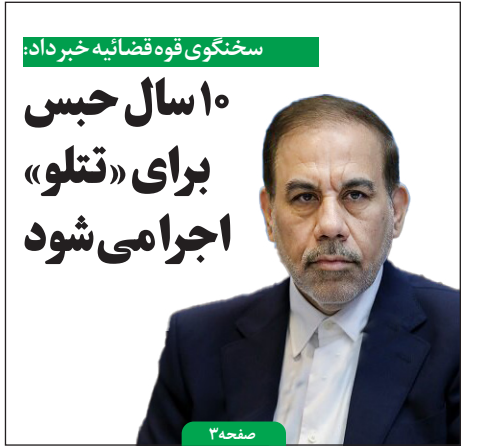
سخنگوی قوه قضائیه خبر داد: ۱۰ سال حبس برای «تتلو» اجماعی شود