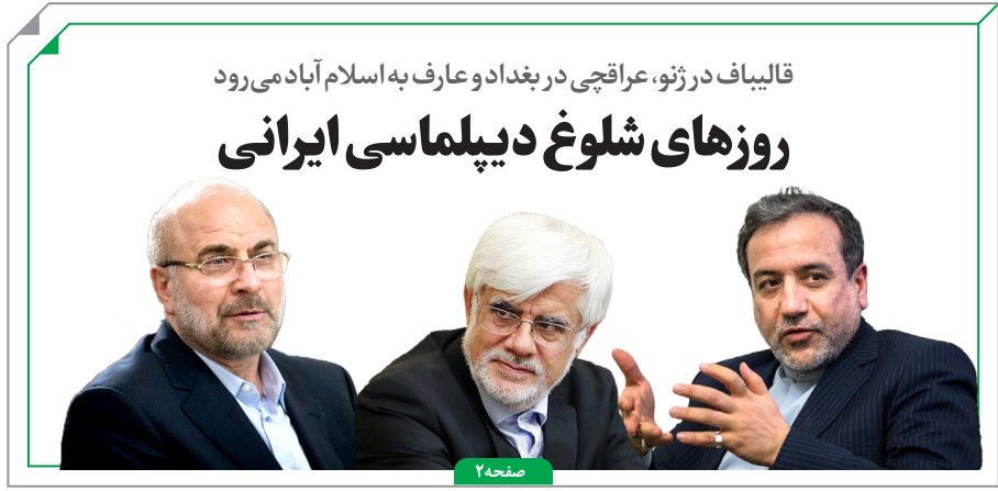
قالیباف در ژنو، عراقچی در بغداد و عارف به اسلام آباد می‌رود