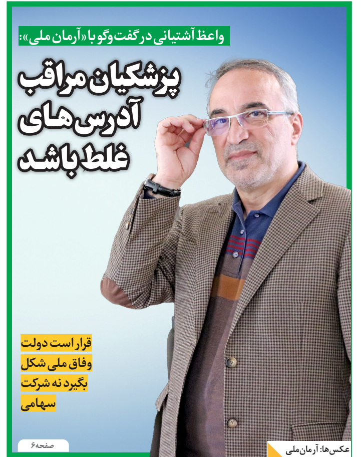
واعظ آشتیانی در گفت‌وگو با «آرمان ملی»: