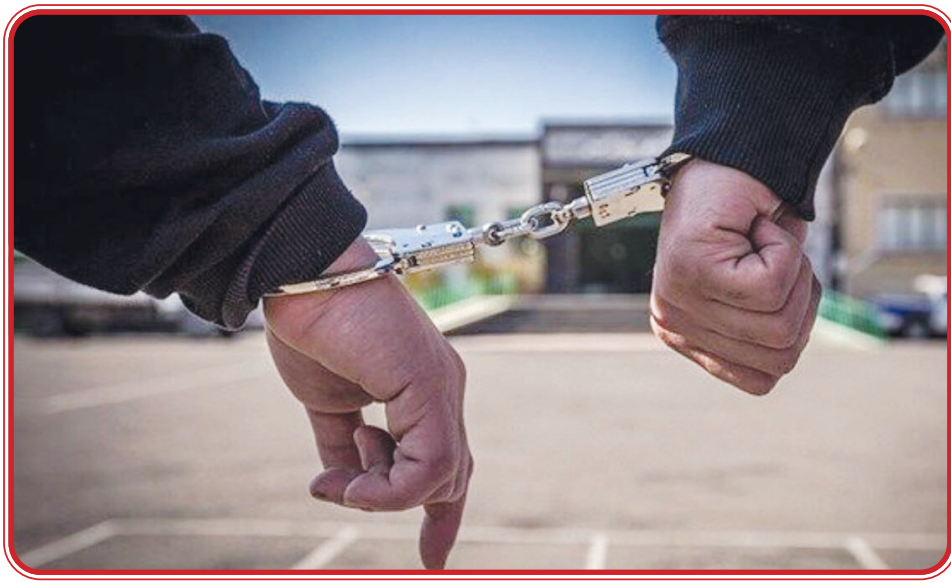
به شهروندان توصیه کرد: در هنگام مسافرت رفتن و یا دوری از خانه از در اختیار گذاشتن کلید منزل خود به افراد غریب را...

جانشین پلیس پیشگیری تهران بزرگ از دستگیری سرایدار یک مجتمع مسکونی که با سوء استفاده از اعتماد صاحب یکی از واحدهای مسکونی اقدام به سرقت از این خانه کرده بود، خبر داد. سرهنگ اردشیر نادری اظهار کرد: در پی تماس و گزارش یک فقره سرقت از منزل توسط یکی از همسایه های واحد مسکونی در محله نیاوران تهران، دستگیری سارق در دستورکار تیم عملیات کلانتری ۱۲۳ نیاوران قرار گرفت. پس از مراجعه مأموران به محل سرقت و بررسی فیلم های ضبط شده توسط دوربین های مداربسته ساختمان و اطراف و همچنین استفاده از شیوه های نوین پلیسی موفق به شناسایی هویت متهم شدند که متهم سرایدار همان ساختمان بوده است. نادری افزود: تیم عملیات کلانتری ۱۲۳ با هماهنگی مقام قضائی به مخفیگاه متهم مراجعه کردند و موفق به دستگیری وی شدند. متهم ۲۵ ساله که از اتباع یکی از کشورهای همسایه است، با اعترافات خود گفت که سرایدار این مجتمع مسکونی بوده و صاحب واحد مسکونی، کلید منزل خود را در اختیار وی قرار داده و به مسافرت خارج از کشور رفته است. وی نیز خیانت در امانت کرده و مبلغ ۱۵ هزار دلار از منزل صاحب ملک سرقت کرده است. جانشین پلیس پیشگیری پایتخت خاطر نشان کرد: با تکمیل پرونده متهم برای سیر مراحل قانونی به دادسرا معرفی شد. نادری