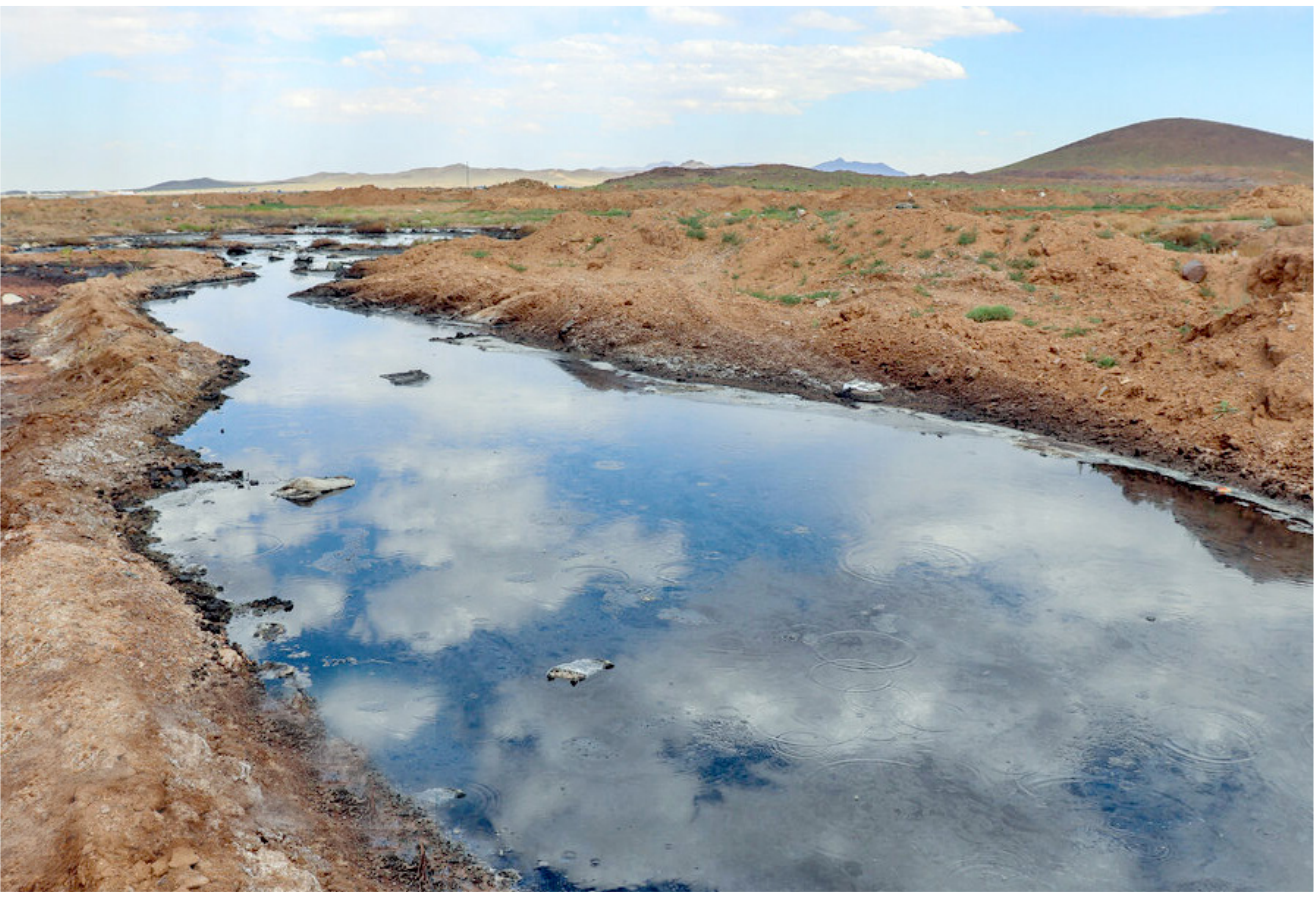
طرح توسعه تصفیه‌خانه مامونیه در استان مرکزی از ۵ سال پیش در دستور کار قرار داشت اما این طرح هنوز به اتمام نرسیده و فاضلاب همچنان در محل مورد اشاره به بدترین وجه ممکن تخلیه می‌شود که لازم است با در نظر گرفتن ملاحظات زیست محیطی و ایجاد زیرساخت لازم، تصفیه‌خانه فاضلاب آماده سازی و فعال شود.