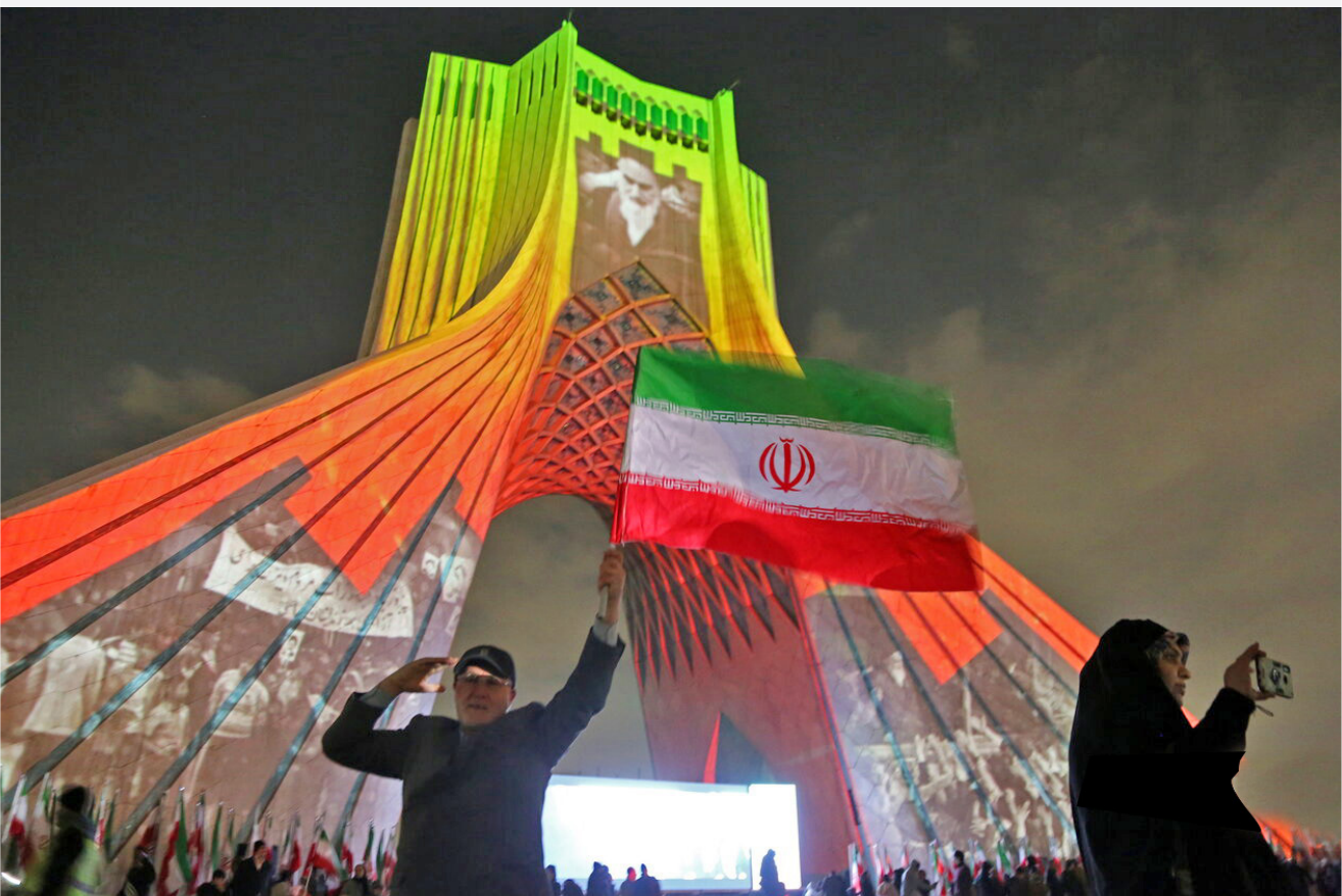
مراسم راهپیمایی ۲۲ بهمن ۱۴۴۳ ساعت ۹ و ۳۰ دقیقه دوشنبه به صورت رسمی و همزمان در بیش از هزار و ۴۰۰ بخش، شهر و شهرستان و بیش از ۳۸ هزار روستای کشور ساعتی پیش از آغاز رسمی مراسم با حضور اقشار مختلف مردم در مسیرهای تعیین شده برگزار شد.