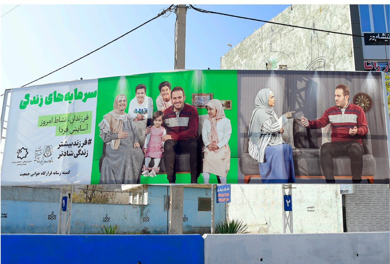
در یکی از تقاطع‌های اصلی شهر نیشابور تصویر دو خانواده نشان داده می‌شود. یک خانواده بی‌فرزند که هر روز زن و شوهر مشاجره و اوقات‌شان تلخ می‌شود و در عکس دوم خانواده‌ای با فرزندان بیشتر، خوشحالی مادر و پدر را به دنبال دارد و در آینده خواهرها و برادرها بیشتر به هم کمک می‌رسانند. به امید آنکه آینده‌ای این چنین برایشان پیش بیاید.