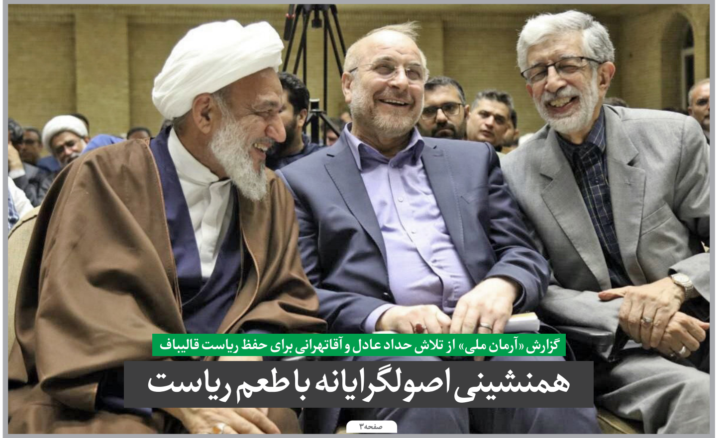
گزارش «آرمان ملی» از تلاش حداد عادل و آقائهرانی برای حفظ ریاست قالیباف