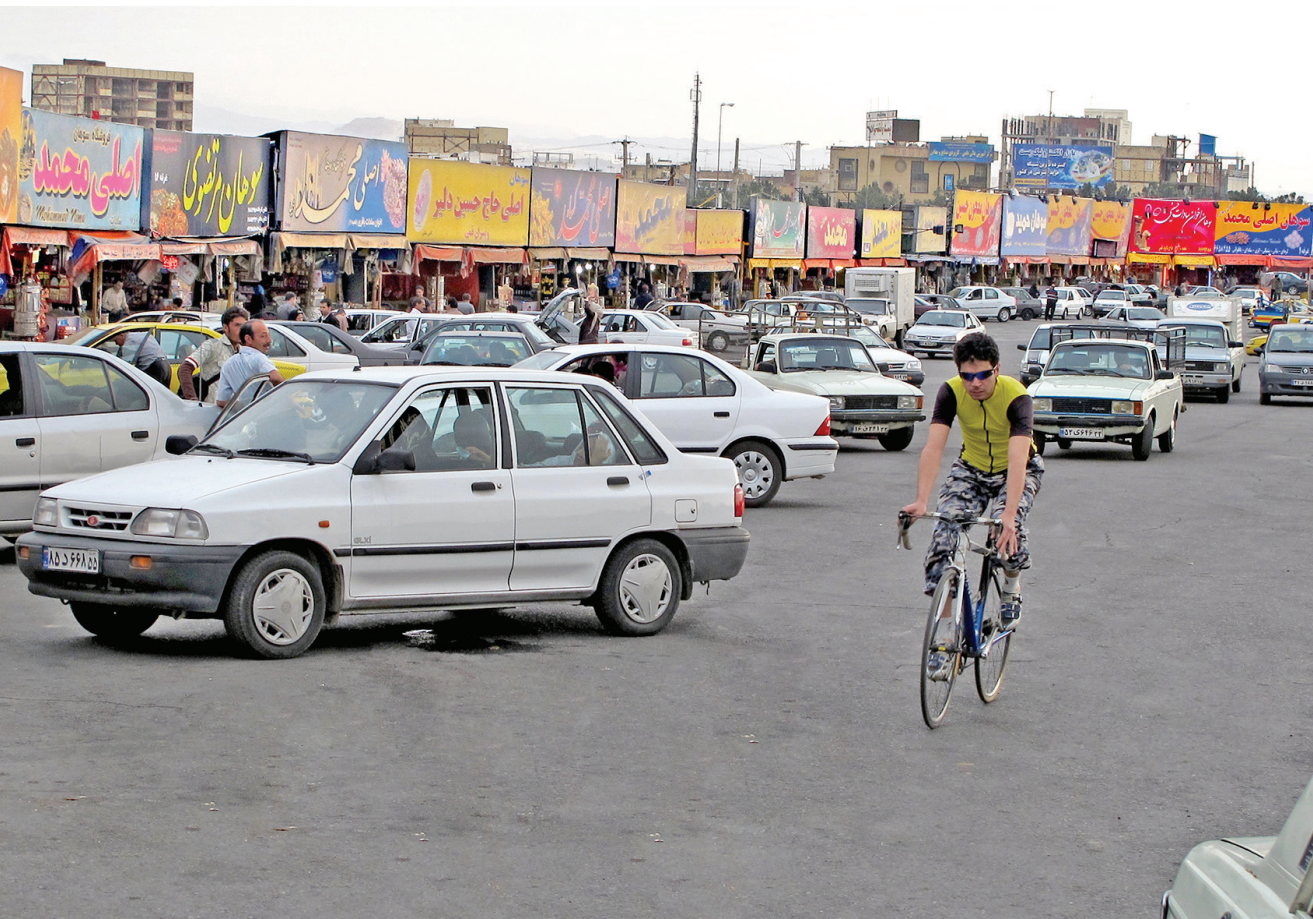
شهر قم از بازارهای معروف در زمینه تولید و فروش انواع سوهان است. در ورودی و خروجی های این شهر شاهد چنین تابلوهایی از مغازه سوهان فروشی فلانی و پسران هستیم.