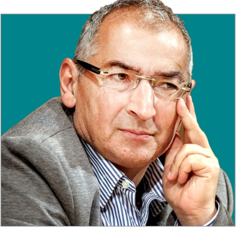
صادق زبیاکلام در گفت و گو با «آرمان ملی»: دولتی که خود را در مقام پاسخگویی نبیند رسانه ها را محدود می کند