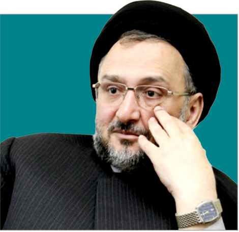
محمد علی ابطحی: رئیس جمهور باید این آب باریکه ای که برای نقد وجود دارد، حفظ کند

کارشناسان و صاحب نظران است اینکه اگر فرصت نقد از رسانه های منتقد داخل گرفته شود این مرجعیت رسانه به خارج خواهد رفت که مسائل و مشکلات خاص خود را خواهد داشت.