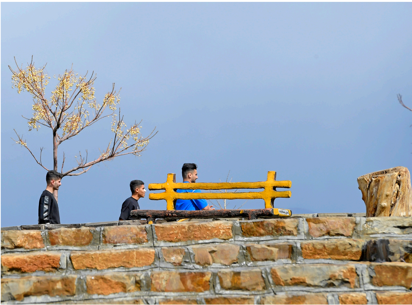
این پارک یکی از مکان های تفریحی و مفرح برای مردم این شهر و هر گردشگری ست که به کردستان سفر می کنند.