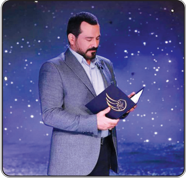
مدیر کل دفتر موسیقی مطرح کرد

من از این رفتارهای غیرحرفه ای گلایه دارم. تهیه کننده و مجری «زندگی پس از زندگی» یادآور شد: برنامه نه تنها در زمان خود پخش می شود بلکه امسال یک قسمت اضافه هم تولید کرده ایم و یک روز هم پیشواز می رویم، به این ترتیب یک روز قبل از ماه رمضان یعنی دوشنبه ۲۱ اسفند شروع پخش برنامه خواهد بود. موزون با اشاره به تمایزهای برنامه امسال تصریح کرد: تفاوت ویژه ای در استودیوی برنامه حاصل شده است که حتما برای مخاطب جذاب خواهد بود و تنوع و فرم تصویر ضبط شده در شهرها و استان های کشور به بختگی و بلوغ رسیده است. وی در پایان بیان کرد: امسال چهار سوزه بسیار خاص داریم که بیش از ۲۵ است دنبال آنها می گشتم و امسال به لطف خدا پیدایشان کردم؛ سوزه هایی که در حوزه تجربه های نزدیک به مرگ منحصر به فرد هستند و محققان این تجربه ها را قطعاً شگفت زده خواهد کرد. ضبط برنامه تا اسفند ماه ادامه داشت و قسمت های اولیه آماده پخش شده است.