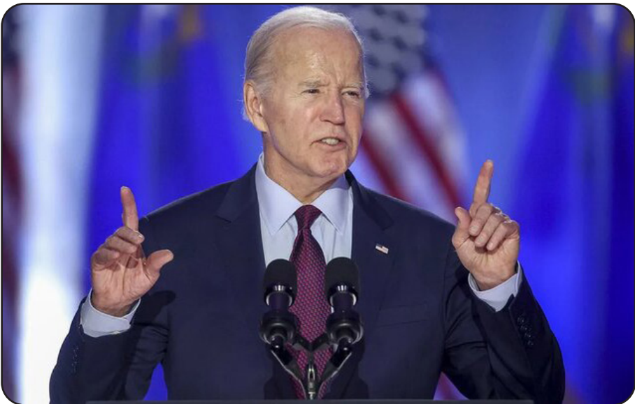
بایدن در جمع شماری از هوادارانش در ایالت نوادا به آنها گفت که به تازگی با رئیس جمهور سابق فرانسه که نزدیک به رئیس جمهور آمریکا در جریان سخنرانی انتخاباتی خود