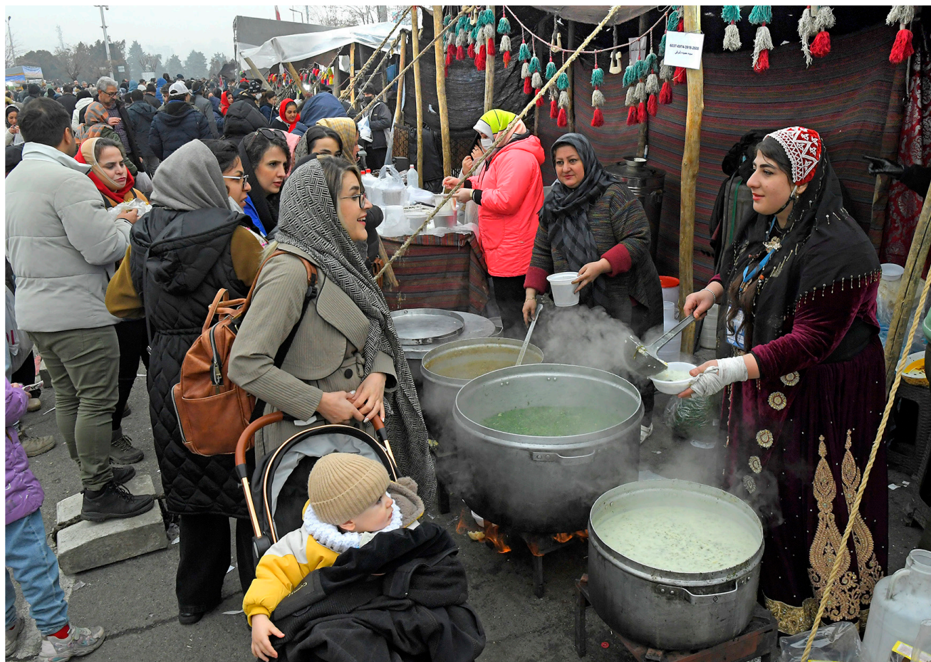
هدهمین نمایشگاه بین‌المللی گردشگری و صنایع دستی ایران-تهران ۱۴۰۳